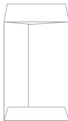
↑ 出来上がり 裏面図